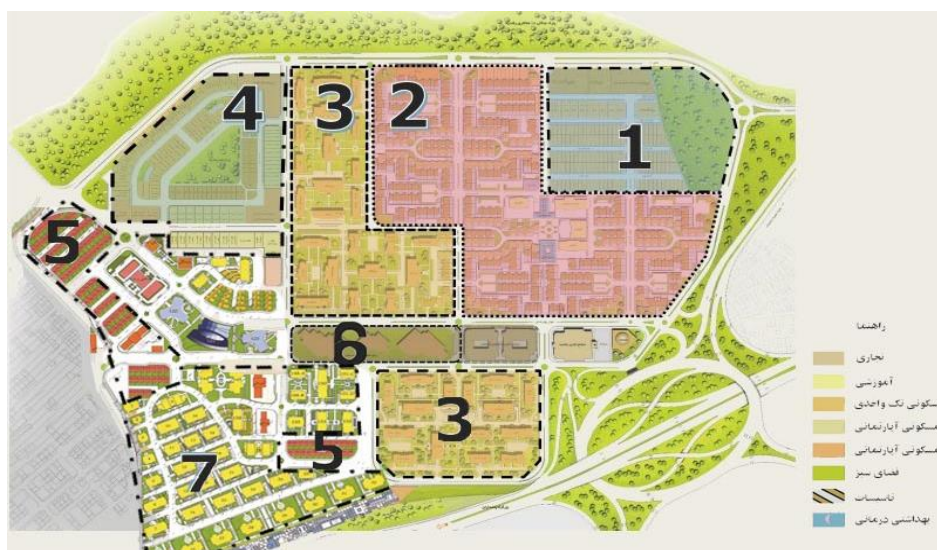
شکل ۳. الگوهای بافت مسکونی رشدیه تبریز