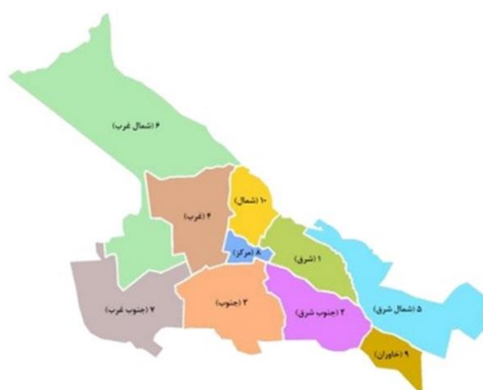
شکل ۲. مناطق شهر تبریز