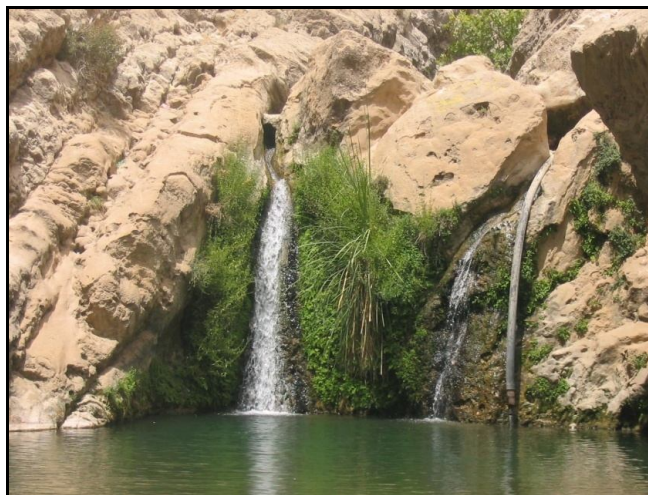
شکل ۵- یکی از آبشارها و حوضچه‌های شکل گرفته در دره رقز

می‌باشد. دیواره‌های آن از سنگ یکپارچه و مقاوم تشکیل شده و در اکثر قسمت‌ها شیب زیاد (۸۵° تا ۹۰°) دارد. این دره به طول تقریبی ۴ کیلومتر در امتداد شمال به جنوب از سرچشمه رقز تا دره جنوب ۶۰ آبشار و حوضچه طبیعی را در خود جای داده، که تنها ۱۴ آبشار و آبگیر دره جنوبی مورد توجه گردشگران و کوهنوردان است (شکل ۵).