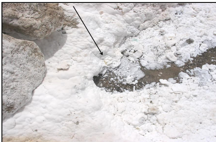
شکل ۴- یک چشمه نمکی در پای گنبد نمکی کرسیا

(۱) چشمه‌های نمکی: در قسمت جنوب و جنوب‌شرقی این گنبد چشمه‌هایی نمکی وجود دارند. این چشمه‌ها همراه خود مقادیر نمک داشته که پس از خروج گنبد به دلیل کم بودن مقدار آب چشمه‌ها و تبخیر آب، در فاصله اندکی از گنبد و در پای آن، نمک چشمه‌ها بر جای می‌ماند (شکل ۴).