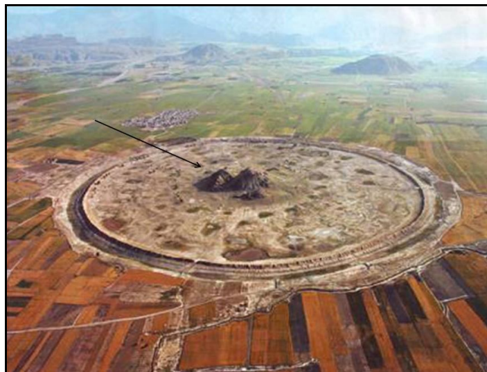
شکل ۳- گنبد نمکی دارابگرد

گنبد نمکی دارابگرد: گنبد نمکی دارابگرد در وسط دشت سرسبز و پهناور داراب سر از خاک بر آورده است. این کوه نمکی مرکز شهر باستانی دارابگرد می باشد که دیواری حلقوی آن را در برگرفته است (شکل ۳).