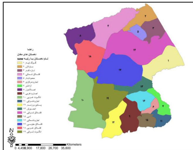
شکل ۵: رتبه بندی دهستان ها با استفاده از تکنیک SAW