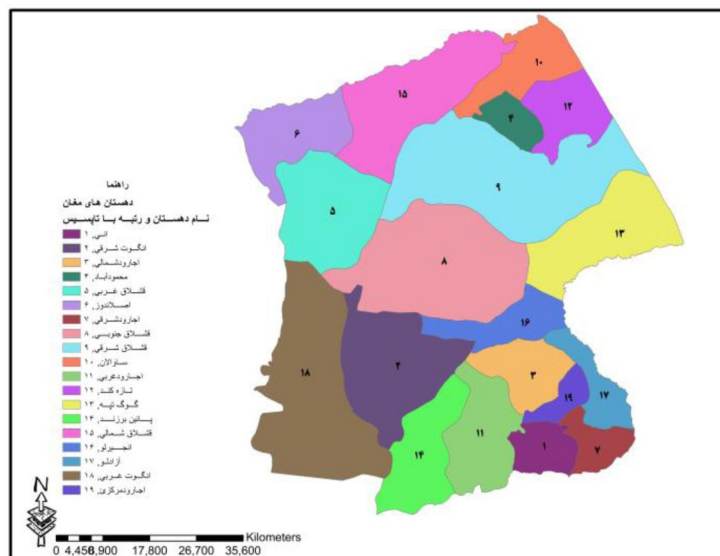
شکل ۳: رتبه‌بندی دهستان‌ها با استفاده از تکنیک تاپسیس