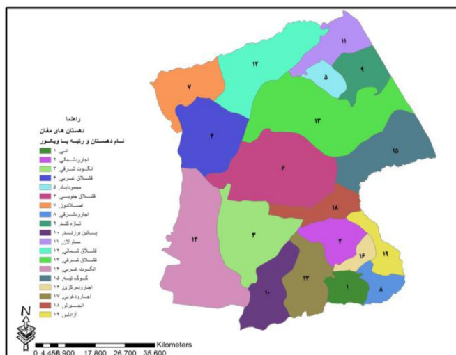
شکل ۴: رتبه‌بندی دهستان‌ها با استفاده از تکنیک ویکور