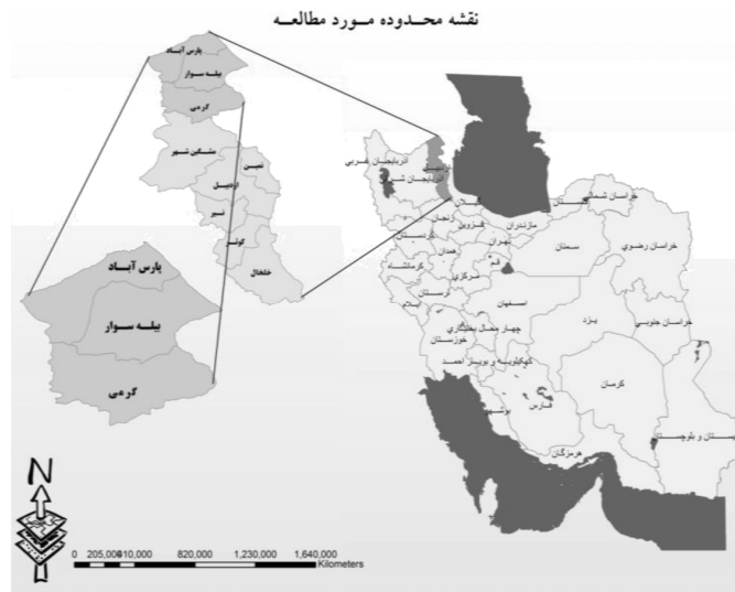
شکل ۱: نقشه موقعیت مورد مطالعه.