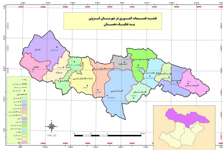
شکل ۱: موقعیت محدوده مورد مطالعه به تفکیک دهستان