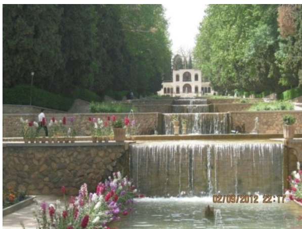
شکل ۲- باغ شاهزاده ماهان- بخش ماهان شهرستان کرمان