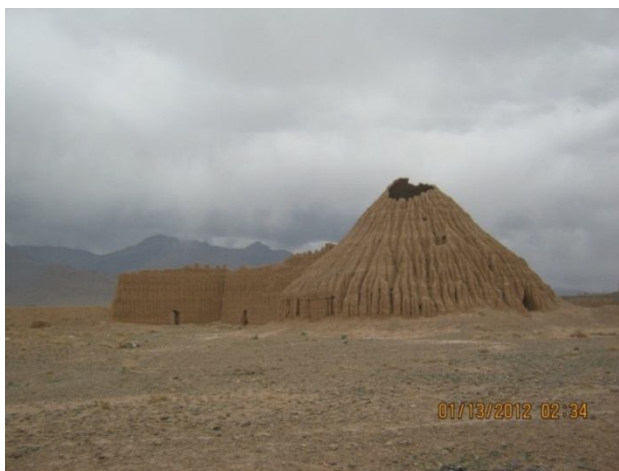
شکل ۱- یخدان لنگر- بخش ماهان شهرستان کرمان

محلی، تکثیر و اشاعه نتایج مطالعات برنامه‌ریزی‌های انجام شده برای توسعه گردشگری روستایی در منطقه در میان مسئولان، مدیران و برنامه‌ریزان پیشنهاد می‌گردد.