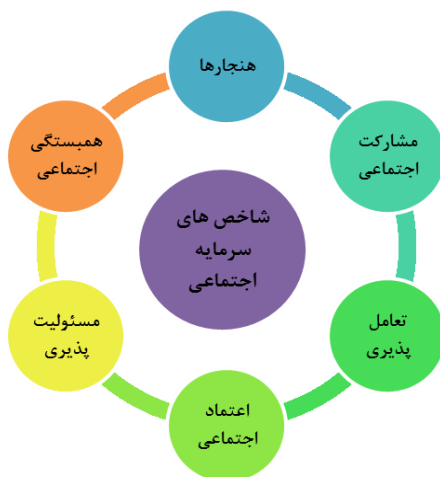
شکل ۱- شاخص‌های سرمایه اجتماعی

انسجام و همبستگی اجتماعی: انسجام اجتماعی به معنای آن است که گروه وحدت خود را حفظ کرده و با عناصر وحدت‌بخش خود تطابق و هم‌نوایی داشته باشد. همبستگی و انسجام، احساس مسئولیت بین چند نفر یا چند گروه است که از آگاهی و اراده برخوردار باشند و حائز یک معنای اخلاقی است که متضمن وجود اندیشه یک وظیفه یا الزام متقابل است و نیز یک معنای مثبت از آن بر می‌آید که وابستگی متقابل کارکردها، اجزا و یا موجودات در یک کل ساخت یافته را می‌رساند. در دیدگاه جامعه‌شناسی، همبستگی پدیده‌ای است که بر اساس آن در سطح یک گروه یا یک جامعه، اعضا به یکدیگر وابسته و به طور متقابل نیازمند یکدیگر هستند. این امر مستلزم طرد آگاهی و نفی اخلاقی مبتنی بر تقابل و مسئولیت نیست بلکه دعوت به احراز و کسب این ارزش‌ها و احساس الزام متقابل است (همان به نقل از بیرو، ۱۳۹۲: ۳۹).