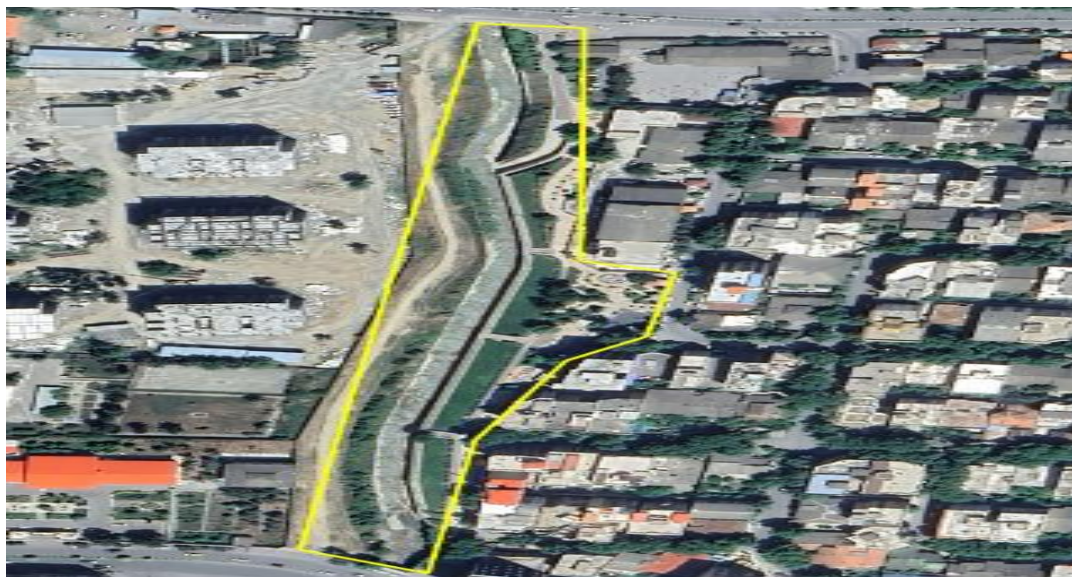
شکل ۱. تصویر هوایی و محدوده پارک گل‌ها