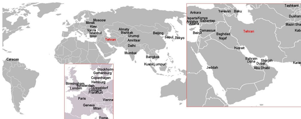
شکل ۳- شبکه پروازی فرودگاه‌های بین‌المللی جهان به فرودگاه امام خمینی (ره) ۱۳۸۶

مولفه‌های فوق‌الگوی سری زمانی به کار گرفته شده در این تحقیق به شرح زیر می‌باشد: