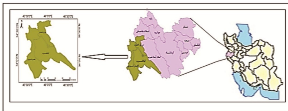
شکل ۱- موقعیت جغرافیایی قطب گردشگری قصرشیرین

گستره استان کرمانشاه با مساحتی ۲۴۴۹۳/۲۵ کیلومترمربع حدود ۱/۴۵ درصد از مساحت کل ایران را دارا می‌باشد که با ۱۴ شهرستان در غرب کشور قرار دارد (سالنامه آماری استان کرمانشاه، ۱۳۹۰). استان کرمانشاه در همه زمینه‌های گردشگری دارای پتانسیل‌های زیادی است بر این اساس با توجه به تقسیم بندی‌های صورت گرفته در طرح جامع گردشگری، استان به ۵ قطب گردشگری تقسیم شده است که هر کدام از این قطب‌ها شهرستان‌هایی را تحت پوشش قرار می‌دهند. قطب گردشگری قصرشیرین به عنوان یکی از قطب‌های گردشگری استان در غرب استان کرمانشاه قرار گرفته که شامل شهرستان‌های قصرشیرین، گیلانغرب و سرپل ذهاب می‌باشد (شکل ۱).