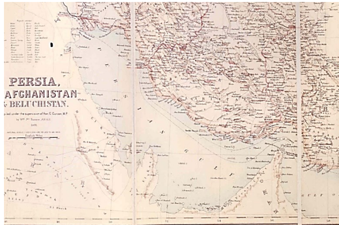
نقشه سال ۱۸۹۱ نقشه نیمه رسمی ایران، افغانستان و بلوچستان که در سال ۱۸۹۱ تحت نظارت لرد کرزن نایب‌السلطنه هند تهیه شد و در ۱۸۹۲ به چاپ رسیده است. در این نقشه جزایر تنب و ابوموسی به رنگ خاک ایران رنگ‌آمیزی شده است. اصل نقشه در اتاق نقشه کتابخانه دفتر هند در لندن، موجود است.

ز) نقشه نیمه‌رسمی «ایران، افغانستان و بلوچستان» ۱ که در سال ۱۸۹۱ با نظارت لرد کرزن نایب‌السلطنه هند تهیه شد و در ۱۸۹۲ به چاپ رسید. در این نقشه جزایر تنب و ابوموسی به رنگ خاک ایران رنگ‌آمیزی شده‌اند. اصل نقشه در اتاق نقشه‌ی کتابخانه‌ی وزارت امور هند در لندن موجود است.