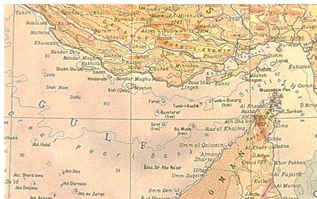
نقشه سال ۱۹۶۷ قسمت خلیج فارس نقشه رنگی ایران در اطلس جهانی که در سال ۱۹۶۷ به دستور شورای وزیران اتحاد شوروی به وسیله نقش اجرایی مصاحی و نقشه کشی به روسی و انگلیسی تهیه و علاوه بر رنگ آمیزی جزایر تنب و ابوموسی به خاک ایران. نام کشور ایران در کنار این جزایر درج گردیده است. اصل این نقشه و اطلس در اغلب کتابخانه های معتبر جهان از جمله کتابخانه مارشال در سازمان ملل متحد، نیویورک و وزارت امور خارجه آمریکا به مر دو زبان موجود است.

ط) نقشه شماره ۱۸، نقشه ۱۸۸۶ وزارت جنگ بریتانیا