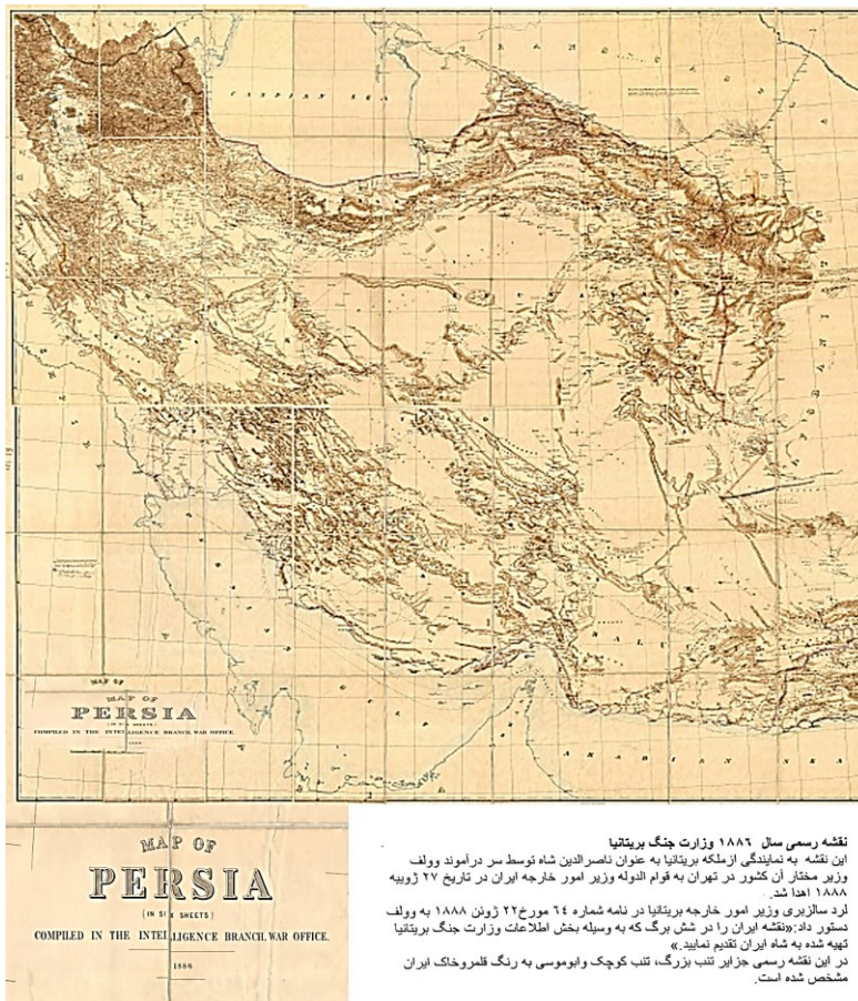
نقشه رسمی سال ۱۸۸۶ وزارت جنگ بریتانیا این نقشه به نمایندگی از ملکه بریتانیا به عنوان ناصرالدین شاه توسط سر دراموند وولف وزیر مختار آن کشور در تهران به قوام الدوله وزیر امور خارجه ایران در تاریخ ۲۷ ژوئیه ۱۸۸۸ اهدا شد. لرد سالزبری وزیر امور خارجه بریتانیا در نامه شماره ۶۴ مورخ ۲۲ ژوئن ۱۸۸۸ به وولف دستور داد: «نقشه ایران را در شش برگ که به وسیله بخش اطلاعات وزارت جنگ بریتانیا تهیه شده به شاه ایران تقدیم نمایید.» در این نقشه رسمی جزایر تنب بزرگ، تنب کوچک و ابوموسی به رنگ فلورخاک ایران مشخص شده است.