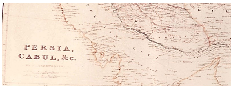
نقشه سال ۱۸۷۳ نقشه ایران و کابل که در سال ۱۸۷۳ به وسیله جی آرو اسمیت تهیه و در انگلیس به طبع رسیده است. در این نقشه جزایر تنب و ابوموسی به رنگ ایران رنگ آمیزی شده است. اصل نقشه در اتاق نقشه کتابخانه دفتر هند در لندن موجود است.

و) نقشه «ایران و کابل» که در سال ۱۸۷۳ به وسیله «جی آرو اسمیت» ۲ تهیه و در بریتانیا چاپ شد و در آن، جزایر تنب و ابوموسی به رنگ ایران رنگ آمیزی شده‌اند. اصل نقشه در اتاق نقشه‌ی کتابخانه وزارت امور هند در لندن نگهداری می‌شود.