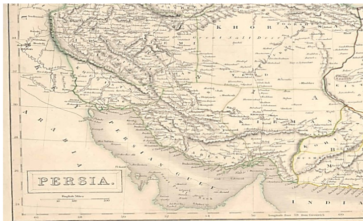
نقشه سال ۱۸۴۰ نقشه ایران که در سال ۱۸۴۰ برای اطلس بلاک بریتانیا تهیه و در لندن به طبع رسیده است . در این نقشه جزایر ابوموسی و تنب بزرگ به رنگ خاک ایران رنگ آمیزی شده است . نقشه مذکور در سال ۱۸۴۴ مجدداً برای اطلس یادشده تهیه و به طبع رسید. در این نقشه جزایر ابوموسی و تنب به رنگ خاک ایران رنگ آمیزی شده است .

د) نقشه ایران که در سال ۱۸۴۰ برای مؤسسه اطلس بلاک بریتانیا تهیه و در لندن چاپ شد. در این نقشه جزایر ابوموسی و تنب به رنگ خاک ایران رنگ‌آمیزی شده‌اند. در نقشه مذکور که دوباره در سال ۱۸۴۴ برای مؤسسه‌ی یادشده تهیه و چاپ شد، جزایر ابوموسی و تنب به رنگ خاک ایران رنگ‌آمیزی شده است.