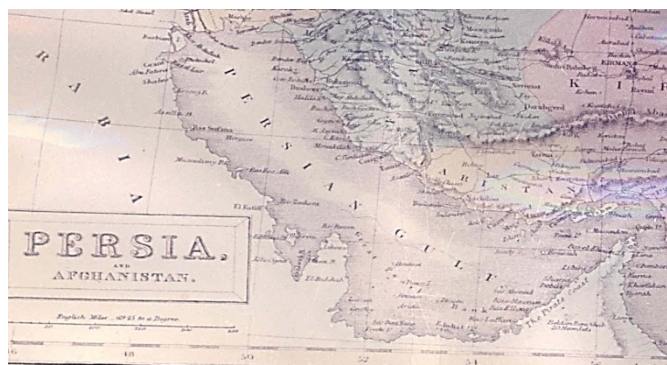
نقشه سال ۱۸۵۴ نقشه ایران که در سال ۱۸۵۴ به وسیله ای. بی. سی. بلاک در ادینبورو انگلیس به طبع رسیده است. در این نقشه جزایر تنب و ابوموسی به رنگ ساحل ایران رنگ آمیزی شده است.

ه) در نقشه «ایران و افغانستان» ۱ که در سال ۱۸۵۴ به وسیله بلاک در ادینبورو بریتانیا به طبع رسیده، جزایر تنب و ابوموسی به رنگ ساحل ایران رنگ آمیزی شده است.